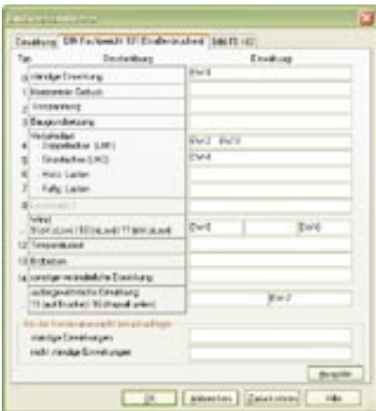
Bild 4: Zuordnung der Einwirkungen zu typisierten Einwirkungskategorien

Ein ganz wesentliches Merkmal des Moduls nach DIN-FB ist die Leistungsfähigkeit der Kombinatorik. Für alle Bemessungssituationen werden alle möglichen Lastkombinationen normgerecht gebildet, berechnet und für die nachfolgenden Nachweise bereitgestellt, ausgehend von den definierten Einwirkungen und deren Zuordnung zu typisierten Einwirkungskategorien. Allein vor dem Hintergrund, dass bei üblichen Brückenabmessungen mehrere hundert Lastfälle (Wanderlasten, mehrere Fahrspuren) durchaus die Regel sind, lässt sich die Leistungsfähigkeit eines solchen Moduls etwas erahnen. Zusätzlich besteht für den Anwender immer die Möglichkeit, die Kombinationen selbst vorzugeben.